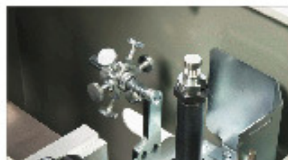
Tope de profundidade variável 02