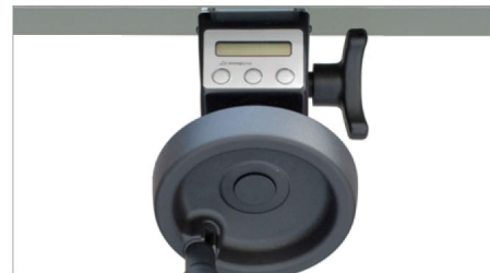
Leitor digital MV