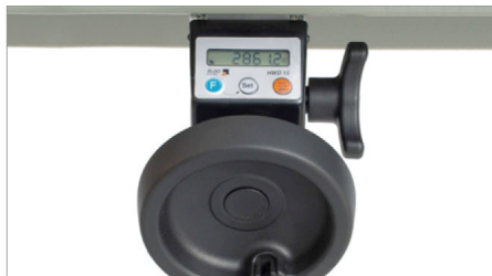
Leitor digital VIS